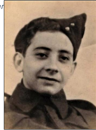
Aankomst met ms Johan van Oldenbarnevelt Amsterdam