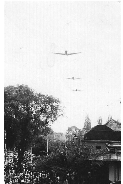
Parade Bodjong.2-6RI.

1 Juli 1946. Erewacht voor Generaal Spoor op het vliegveld van Semarang om 's morgens 9.00 uur en 's middags om 15.00 uur. Inpakken voor definitieve legering op het vliegveld.