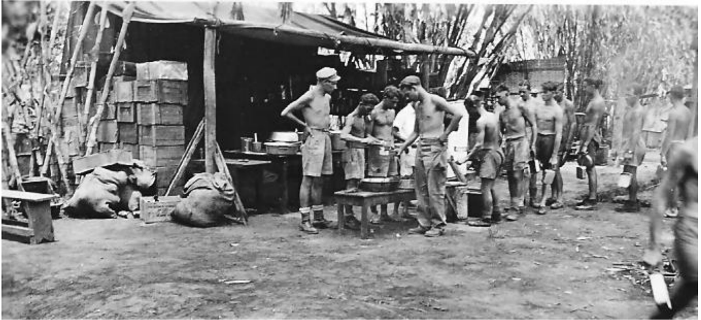
Uitreiking maaltijd onder toezicht.

20 Mei 1947. Tijdelijk compies sergeant majoor. Vind dat wel leuk zowat overal toezicht op houden, zoals bij het uitreiken van de maaltijden met het nodige trammelant er om heen, meestal ging het om te weinig krijgen.