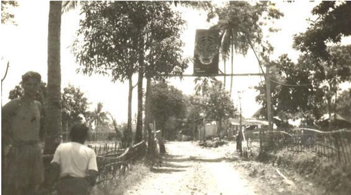
Djempol. Het tijgerbord boven ingang kamp. Links Counet.

22 Oct 1946. Djempoll, bord tekenen en schilderen (vrijheid) en plaatsen bij de ingang van het kamp. Teken van kaart Persilan 1:1000. Om aan te tonen dat wij er waren voor de vrijheid en het recht van de bevolking en voor hun bescherming plaatsten wij borden met het woord Djempol er op aan de voorzijde van ons kampement. Dit bracht de bevolking tot rust en de contacten met onze troepen werden beter.