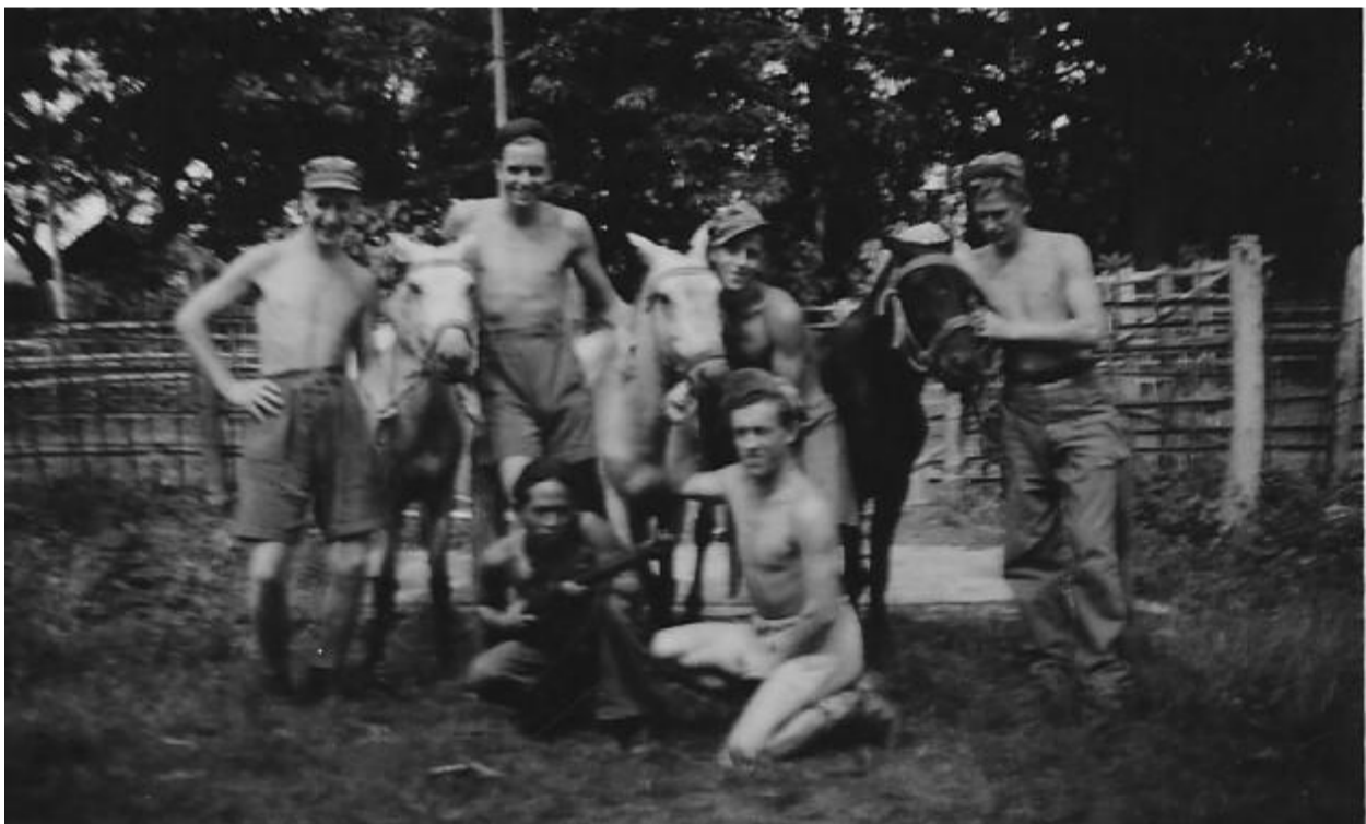
De KNIL- of bergpaardjes.

15 Nov 1947. Kampement in orde brengen en opdracht een nieuwe paardenstal bouwen. Wat is n.l. het geval: we gaan in de toekomst meerdaagse patrouilles uitbreiden met meeneming van de zware mortieren. Die zijn te zwaar om door onze mensen gedragen te worden. Daarom gaan we kleine bergpaardjes meenemen. Dat deden de K.N.I.L. soldaten vroeger ook al. Verder moet ik vandaag lijsten aanleggen voor het innemen van kininetabletten.