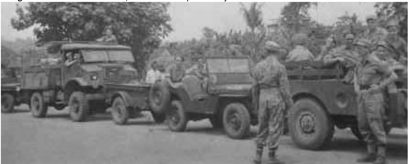
2-6RI vertrekt naar Welerie.

2 Aug 1947. Vertrek naar Welerie, waar onze troepen ook zijn.