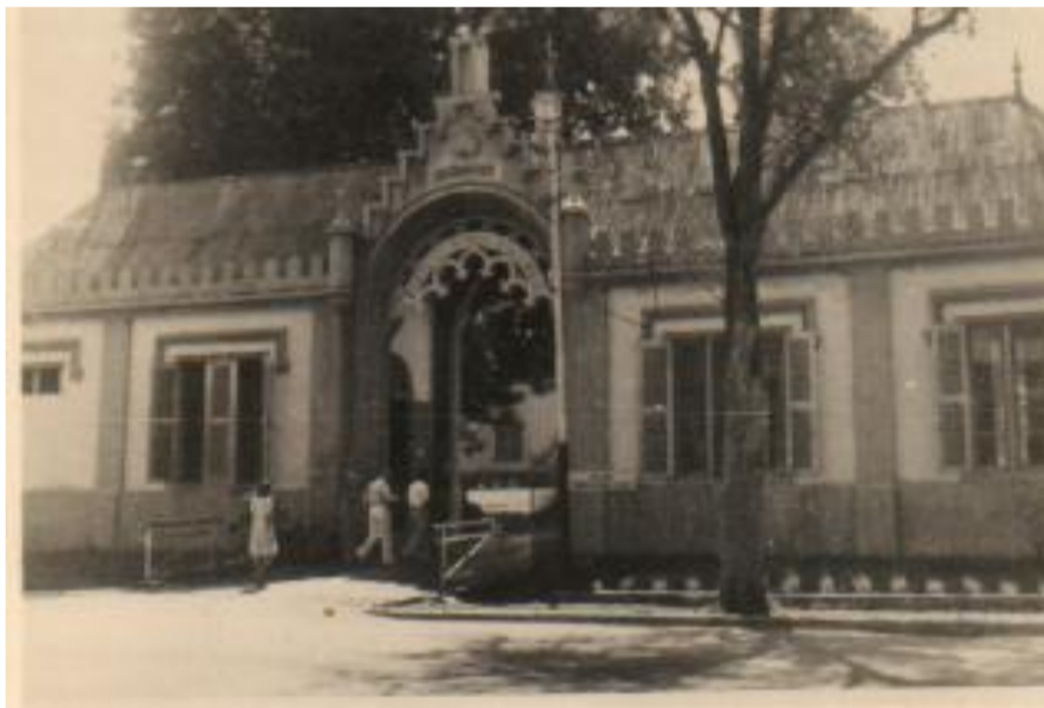
Ingang Protestants Weeshuis Bodjong.

Engelse parachutisten kwamen ons afhalen en vervoerden ons met trucks naar het vroegere weeshuis op de Bodjong. De eerste indruk was goed, mooie gebouwen. Wat wel opvallend was dat er veel rood witte vlaggen hingen. De ligging is slecht; totaal geen meubilair en slapen moesten we op de stenen plavuizen.