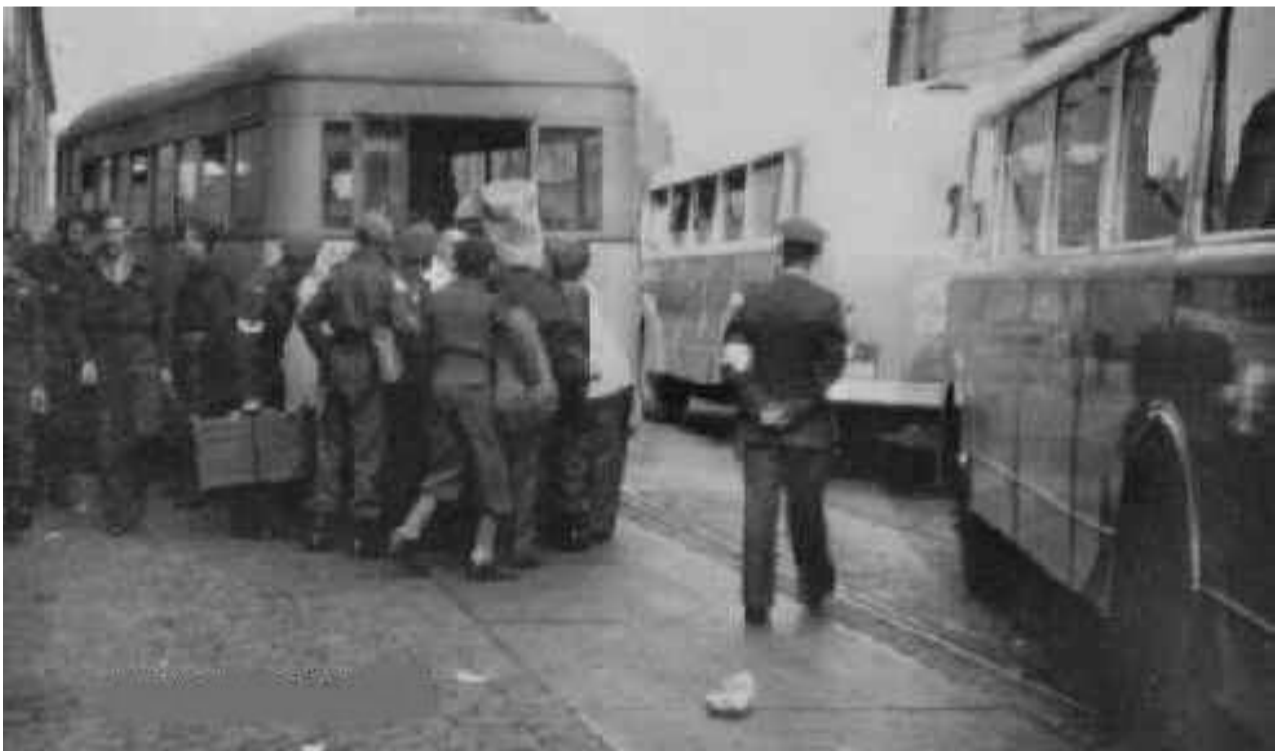
Bij de bussen.