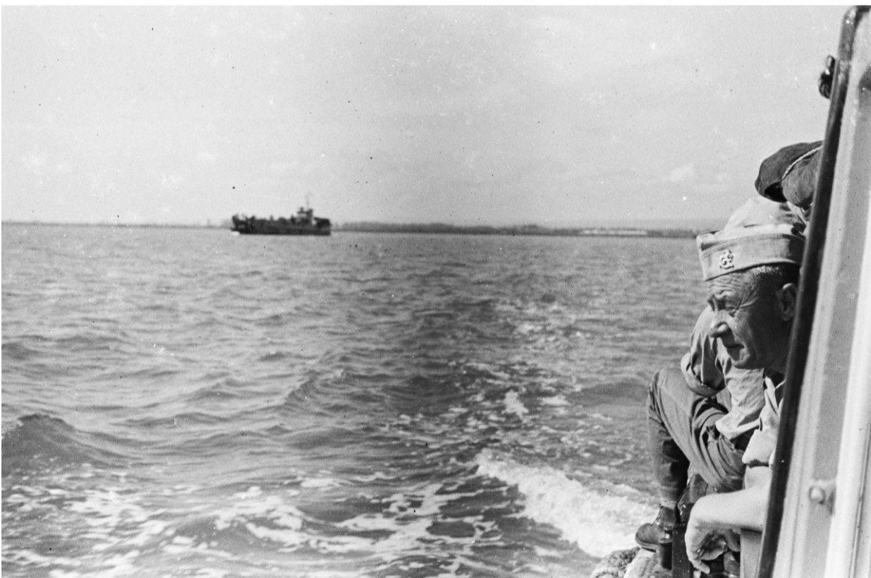
Tabé Java. Tabé Indie. 2-6RI.

Vervolg 24 april 1948. Ik trek me terug van de reling, Java is niet meer. Verdwenen in de horizon, alleen de herinneringen blijven.