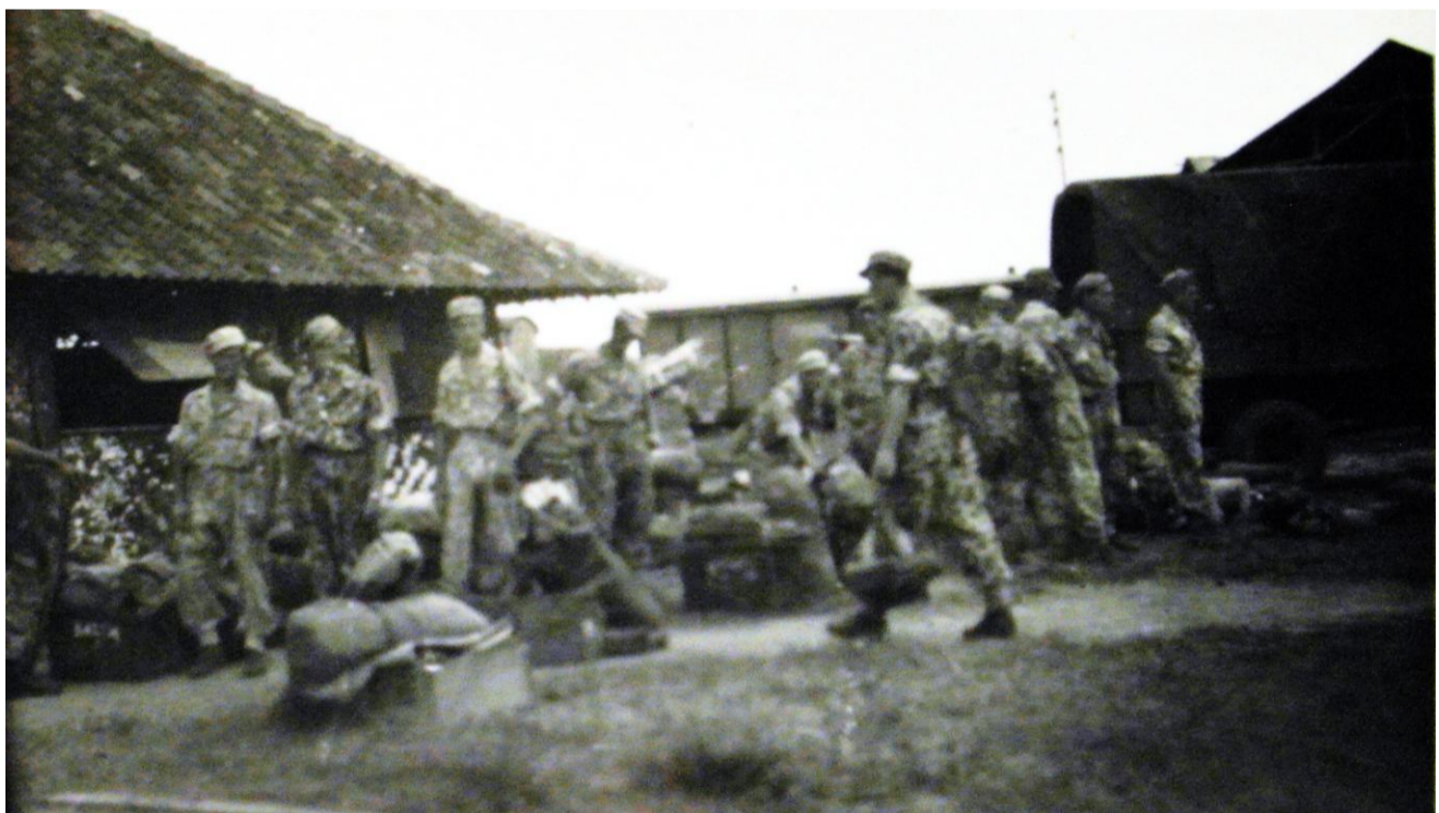
2-6RI maakt zich klaar voor vertrek naar Semarang.

10 April 1948. Brieven naar vrienden en bekenden, dat zijn de laatste voor hen! Alles staat ingepakt en is klaar voor vertrek naar Semarang. De precieze vertrektijden zijn nog niet bekend. Ook niet welke boot het wordt. Dienst wordt er nagenoeg niet meer gedaan, alleen wat wachten en bewaken ons! Aan de lijn is alles rustig. Alles is overgeven aan de dienstplichtige 5-5 R.I. Die al enkele maanden samenwerken met ons.