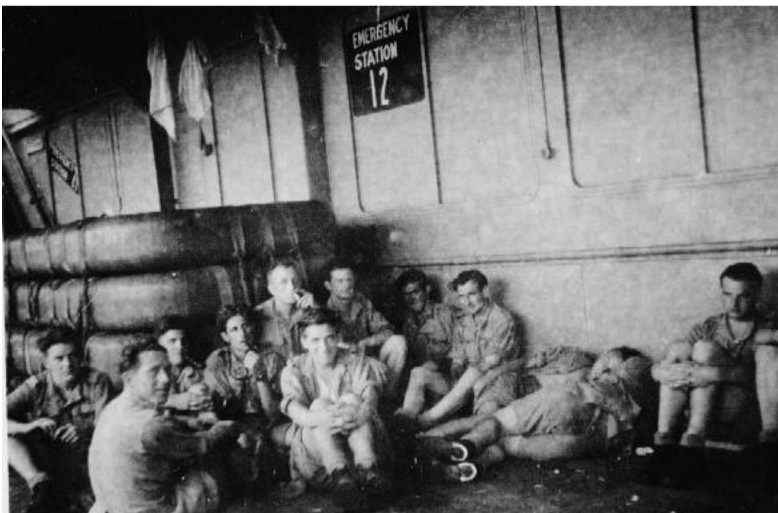
Aan boord Nieuw Amsterdam.

2 November 1945. Mogen nu ons tropenuniform gaan dragen. De temperatuur is al vrij hoog en luieren aan dek is dan ook het enige vertoeven. Na 5 dagen op zee, is het nog steeds ons verwennen met koekjes, cola en sigaretten. We ontmoeten ook het Nederlandse schip S.S.Volendam. We zitten nu op volle zee. Weinig te zien; af en toe een passerend schip.