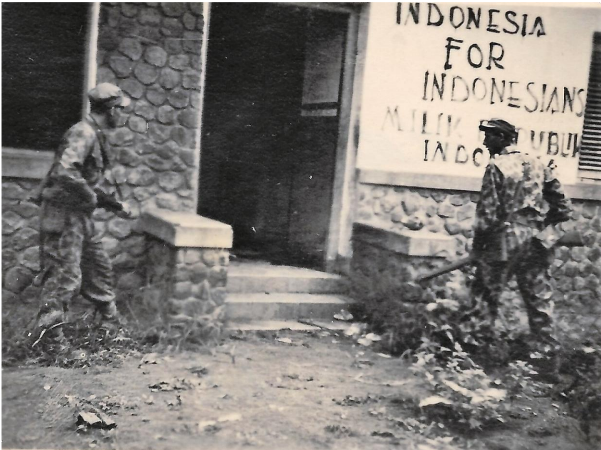
Villa Bertha.

24 Jan 1947. Patrouille naar Koedoengpanie, stuit ter hoogte van villa Bertha op vijandelijke patrouille. Een hoofdofficier en een mindere van de vijand gedood en vijf gewonden aan de kant van de vijand bleven achter.