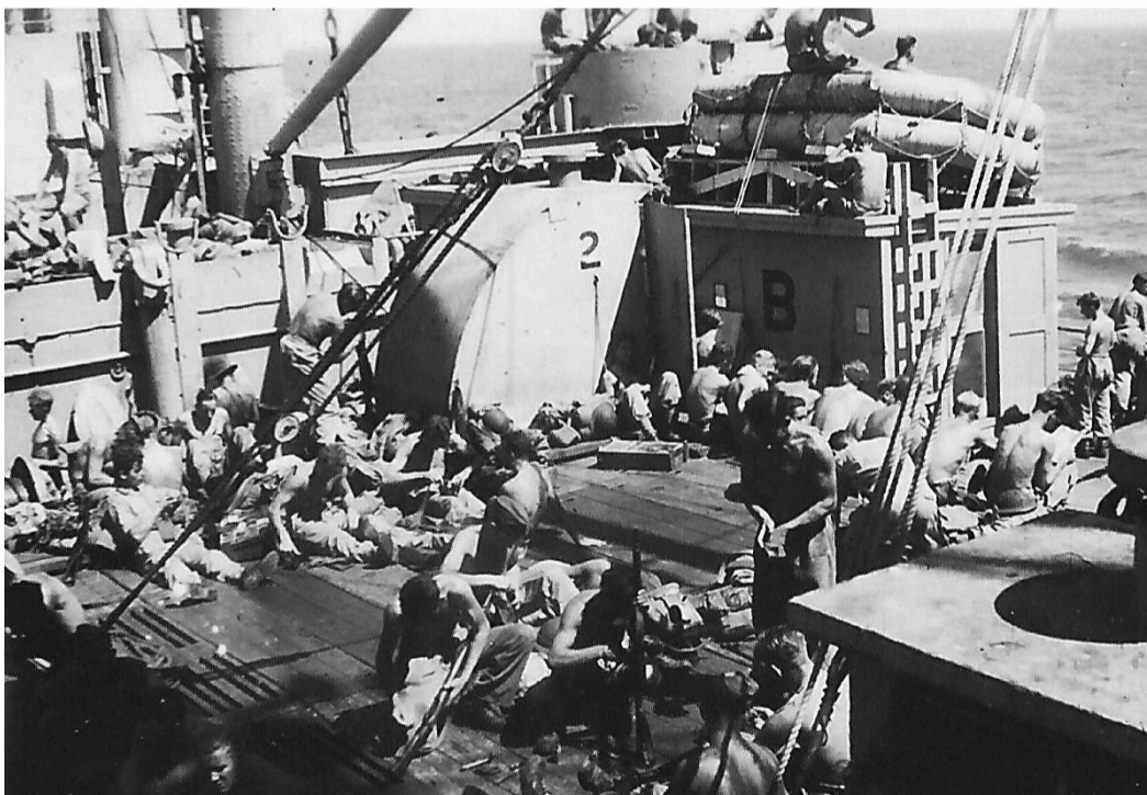
Aan boord v.d. Sommelsdijk. (foto J.v.d.Heijden)

11 Maart 1946 , Op de rede van Semarang. Ieder vraagt zich af hoe we ontvangen zullen worden. Het is 13.30 uur. 2-13 R.I. is reeds aan land.