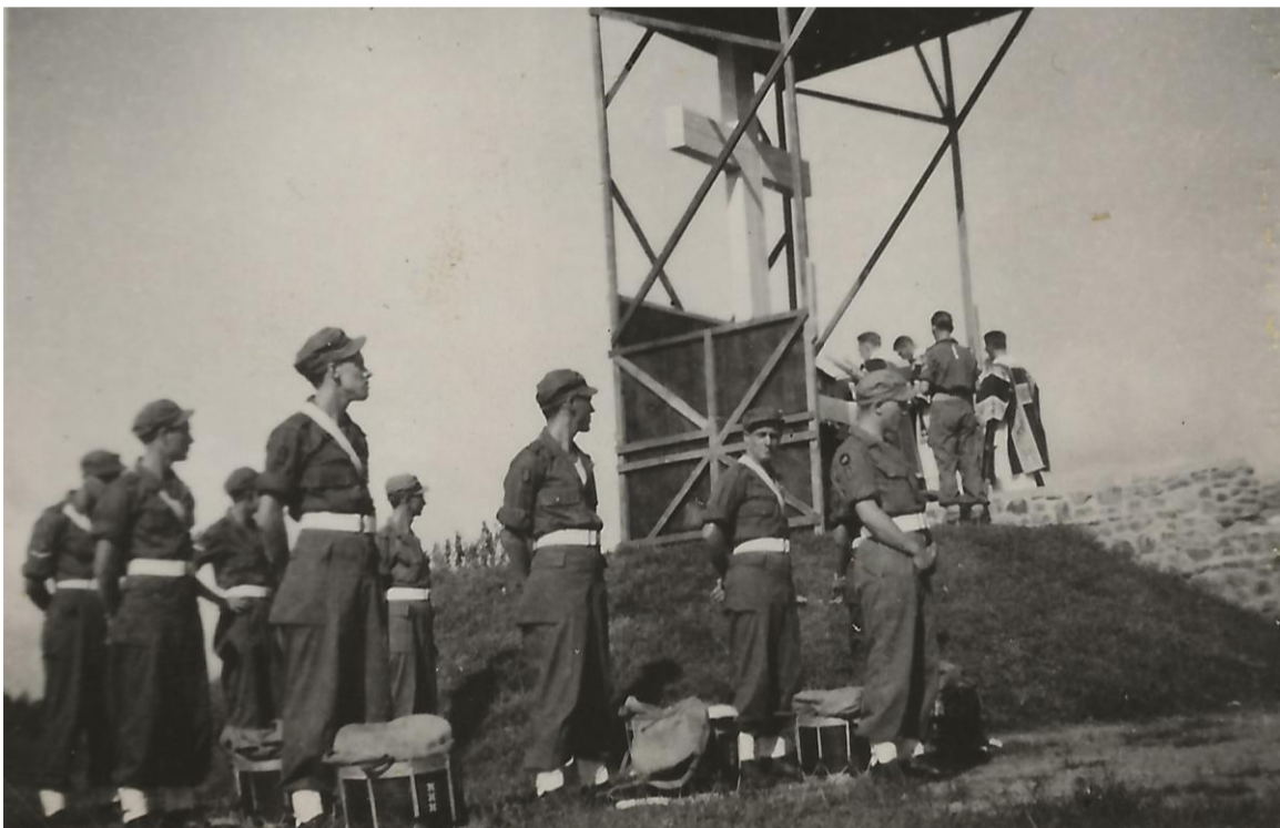
De plechtige Req. Mis op het militair kerkhof Semarang 1947.

26 Mrt 1947. Plechtige Req. Mis op het Militaire Kerkhof. Daarbij aanwezig krijg je toch wel de rilling, dat er al zoveel gesneuveld zijn. Vele zijn in gedachten bij hun vriend die ze niet meer hebben. Ook wij herdenken onze compiesgenoten die hier hun laatste rustplaats hebben en vragen ons af, hoever zijn wij nog af van de weg van vrede en veiligheid.