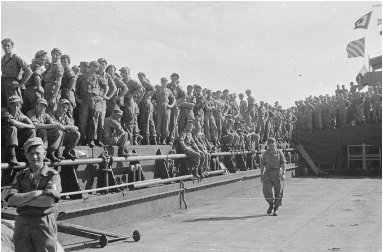
Semarang. Het zit er op! 2-6RI aan boord LCT.

21 april 1948. Om 05.00 uur is het reveille. Ik sliep nog net zo lekker, maar ben toch niet te lui om op te staan. Semarang is nog stil. De bevolking is gewend geraakt aan komen en gaan van troepen. We vertrekken om 07.00 uur vm. Niets vergeten, wordt er gevraagd. Onze zware bagage hebben we daags te voren al afgegeven voor het verschepen, dus we hebben de handjes vrij. Per landingsvaartuigen worden we verscheept naar Batavia, Vanuit Batavia weer met landingsvaartuigen naar de Johan van Oldenbarneveld aankomst aan boord om ongeveer 11.00 uur. Onze ligging is op Dek D.J. Het eten is er goed.