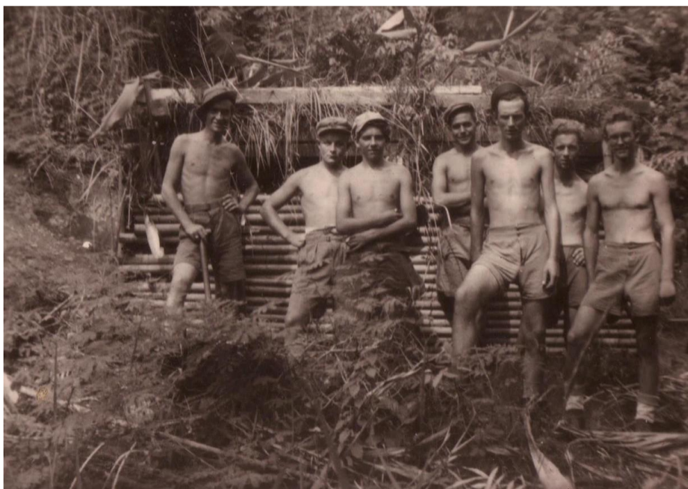
Brenstelling met 2-6Rl's.

20 Sept 1947. Opmars naar Dadapajam. Wij zijn er niet rauwig om. Het is misschien daar beter dan hier. De opmars verloopt rustig. Er zijn enkele schermutselingen van geen betekenis. Tegen de middag arriveren we. Het is weer snel stellingen bouwen geblazen. Dat begint altijd met eenmansputjes. En de brenstellingen zijn van groot belang dat is onze vuurkracht.