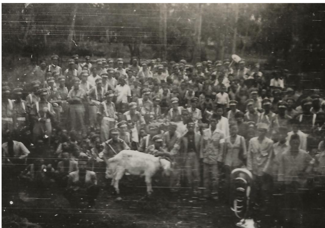
De prins Bernhardkapel in onze kampong.

De Prins Bernhard kapel inclusief Cees de Bok bezocht Persilan, dat werd zeer op prijs gesteld. Dat zij bij ons kwamen, werd vertaald als "we tellen mee" Ze weten dat we er zijn. Dat gaf de soldaat moed!