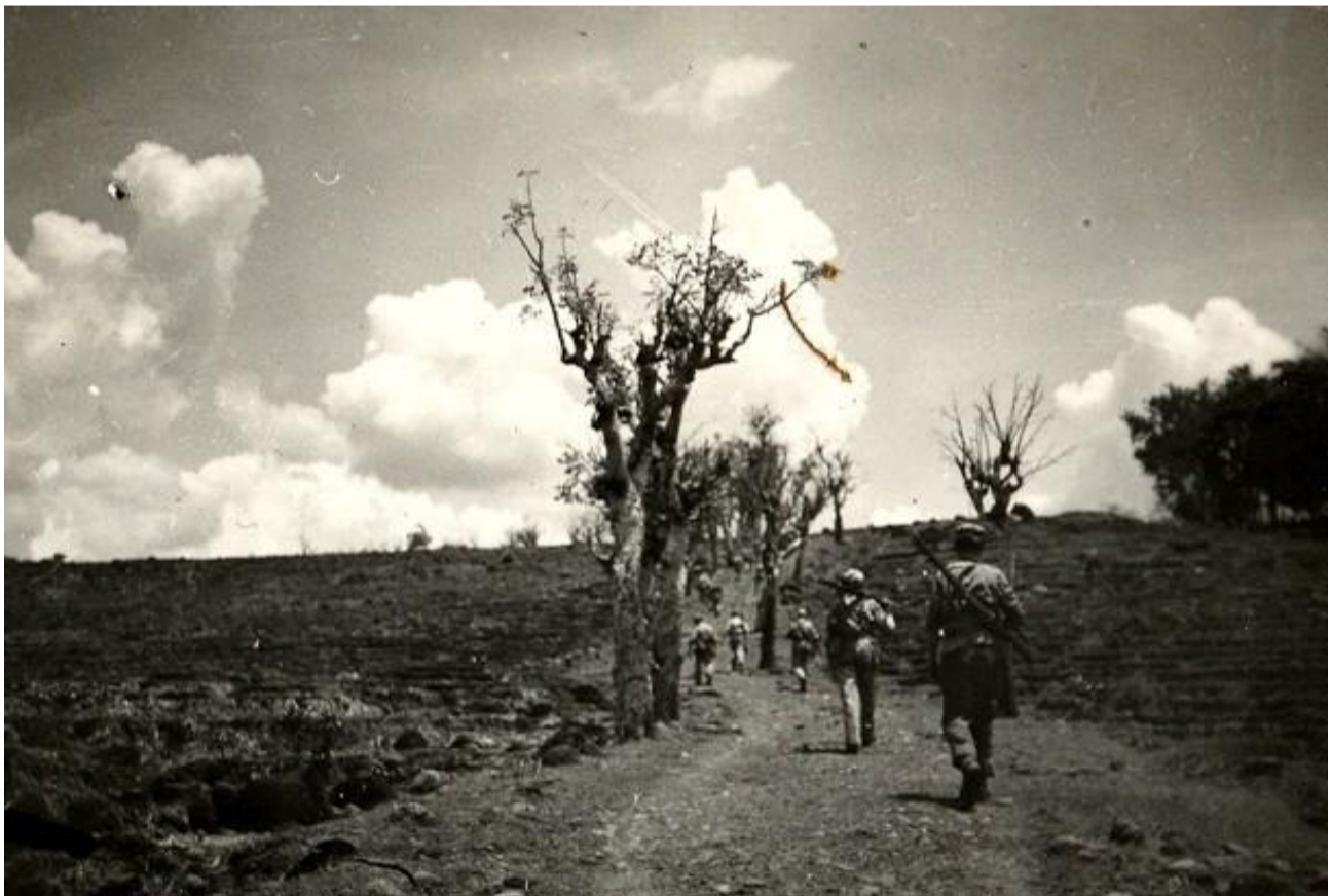
Zware patrouille lopen.

14 Febr 1948. De 4 daagse patrouilles vertrekken, het 2e peleton met de Cie. Cdt. zorgen voor de fourage van de patrouilles. Omdat het gebied vrij uitgestrekt is, worden er wijde en zware patrouilles gelopen, vooral in het bergachtige terrein is dat zeer zwaar. Het eten moet op de juiste plaatsen en tijden aangevoerd worden. Er mag vooral niet te weinig zijn en het moet nog smakelijk zijn ook. Dat vooral voor het moreel en de maag ..... Dus de keuken werkt op volle toeren. De mannen in het veld gaan voor, dus de thuisblijvers mokken wel eens dat zij even moeten wachten, maar er is begrip voor.