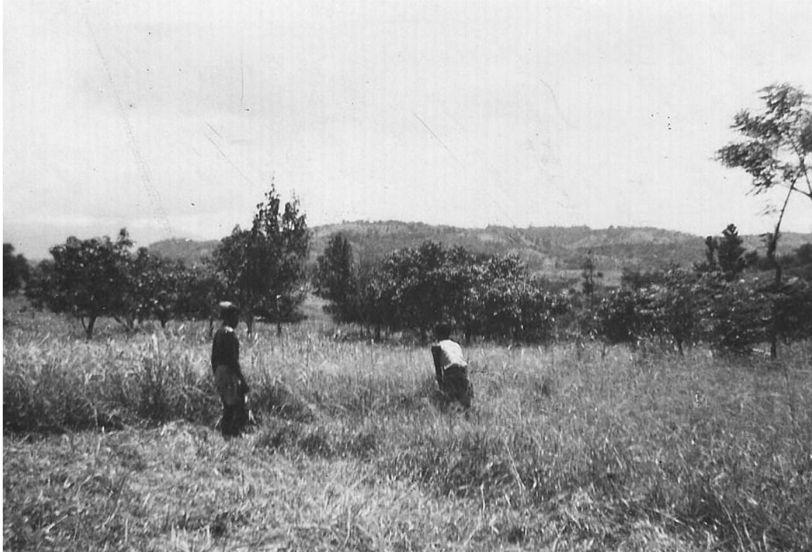
Krijgsgevangenen maken schootsveld schoon.

25 Mrt 1948. Geef de koelies de opdracht het terrein te ontdoen van onkruid. Laat een zandpad van loszand aanleggen langs de draadversperring, daarop mogen zij niet komen. Voetafdrukken zijn dan controleerbaar. De I.D. vond dat goed gevonden.