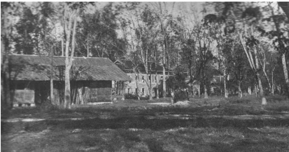
Morrib Beach, verblijven 2-6RI, voormalig Jappenkamp.

Ons kamp ligt aan een moerassig gebied. Hier en daar een stenen gebouw de rest houten barakken maar op een 50 meter van dat alles ligt het mooie strand van de Straat van Malakka. Oorspronkelijk is het een missiepost geweest en de Jappen hebben er een concentratiekamp van gemaakt . Er is geen licht, geen water, geen meubilair. Van de afwatering deugd ook niets overal poelen en plassen. Er is hier nog wel werk aan de winkel.