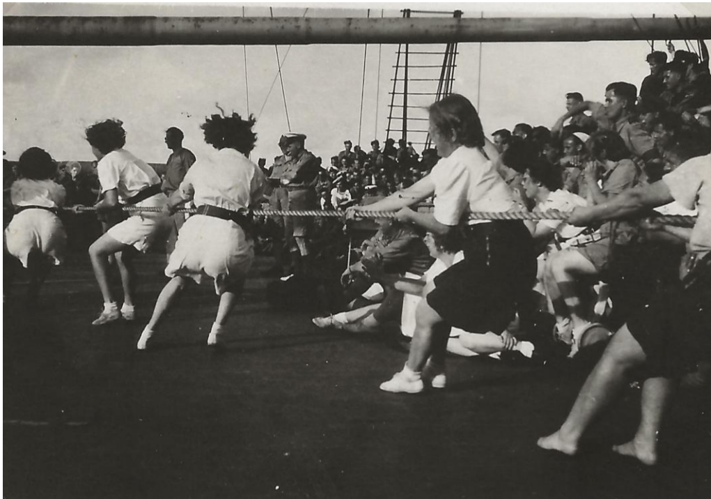
Vermaak aan boord Nieuw Amsterdam.

8 November 1945 . Indische Oceaan. Geen bijzonderheden. Er worden wat spelletjes gedaan, gym en boksen staan op het program, maar ieder laat zich niet graag op het gezicht slaan, dus waren er maar enkele deelnemers