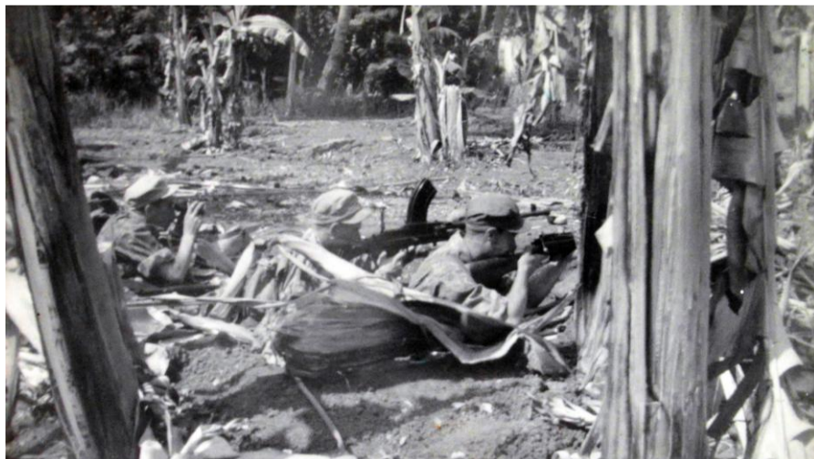
Bren in stelling 1946.

Ten zuiden van Persilan staan kleine hutten, gedeeltelijk worden die plat gebrand om een goed schootsveld te krijgen. Het noordelijk gedeelte is de weg naar Solo. Links en rechts zijn verlaten onderkomen sawa's, recht vooruit in het noorden ligt hoogtepunt 15, voor ons een moeilijk punt. Van hieruit zouden wij goed beschoten kunnen worden. Een goed ingerichte stelling met vaste vuurlijn, zou veel kunnen bijdrage aan onze veiligheid.