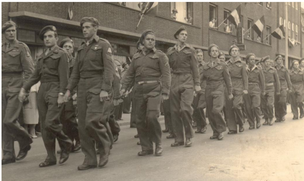
Afscheidsparade Sittard foto hr. Vellinga

14 oktober 1945: ( Zondag ), 801 manschappen van 2-6 R.I. vertrekken naar Indië. Het vertrek van ons bataljon ging met veel afscheid van toegestroomde familie naar Sittard gepaard. Er werden bloemen ten afscheid aangeboden. De manschappen werden geholpen met het dragen van hun plunjezakken door de toegestroomde bevolking van Sittard. De muziek kapel ging voorop. Dat veel familie en belangstellende aanwezig waren komt omdat de avond ervoor het bekend was gemaakt op de radio. Op het stationsemplacement stond het zwart van de mensen. Het afscheid was op vele plekjes ontroerend. Veel moeders,vrouwen maar ook wel vaders en broers en zusjes lieten de tranen hun vrije loop. En terwijl de muziek door schetterde werden op de treinwagons leuzen geschreven als: 'WIJ GAAN SOEKARNO HALEN' en ' Indië VRIJ' etc.