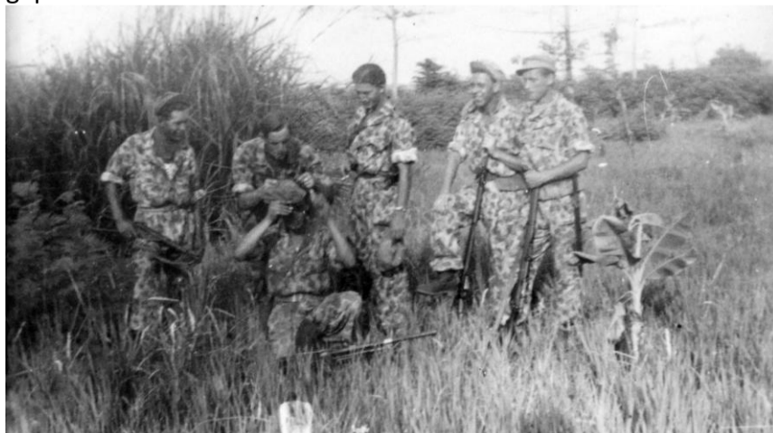
Camouflagepakken. Semarang 1946.