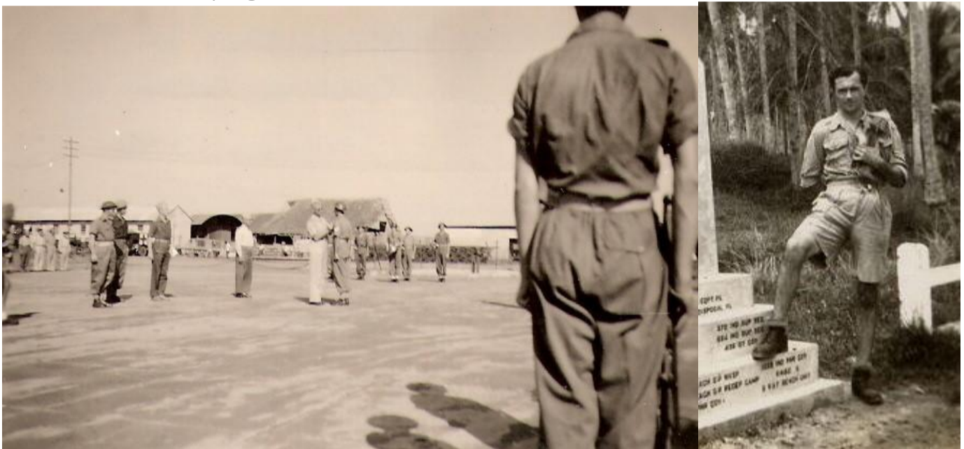
Onderscheiding van Gelder.

29 Juli 1946. Sergeant van Gelder krijgt onderscheiding Bronzen Leeuw voor verdiensten in 1940. Mortieren schieten kampong in brand.