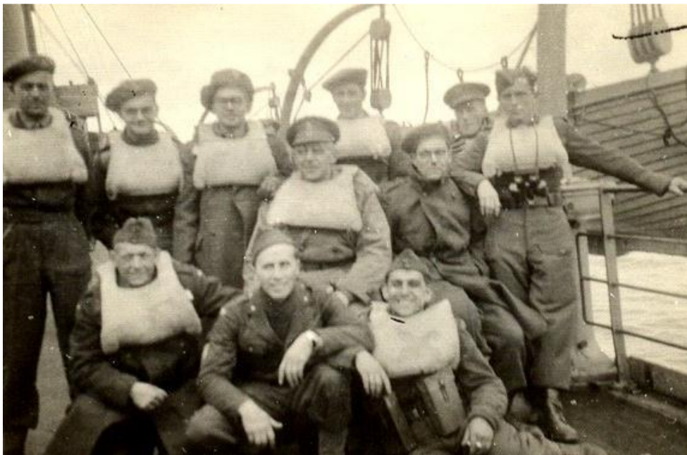
Aan boord Nieuw Amsterdam.

29 October 1945. In de loop van de nacht waren we in een stormachtige golf van Biskaje terecht gekomen, het spookte terdege. Hoge golven sloegen over het dek, bijna iedereen op de boot was zeeziek. Op sommige plaatsen van de boot was het dan ook een hoop kotsel. We liepen nog steeds met onze zwemgordels om vanwege het mijnengevaar. In de loop van de dag mochten we ze afleggen.