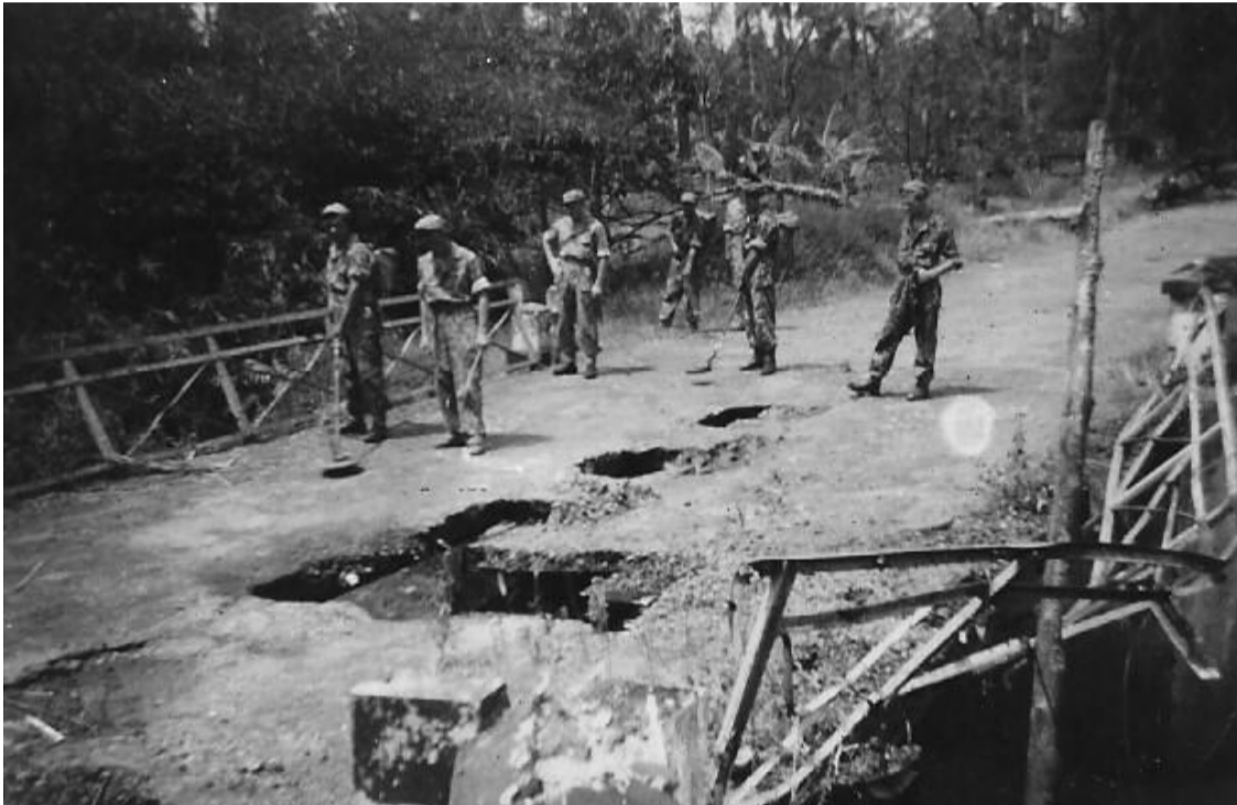
De mijnenopruimers aan het werk.

22 Sept 1946. Om 04.30 uur v.m. klaar staan voor afmars. 07.00 uur start. Bij de driesprong Persilan -Sins Tapak gaan we van de auto's en rukken op naar Persilan. Worden ondersteunt door tanks en artillerie. Mijnenzoekers ruimen de weg van mijnen. Die liggen er maar plentje. De artillerie vuurt over ons heen.