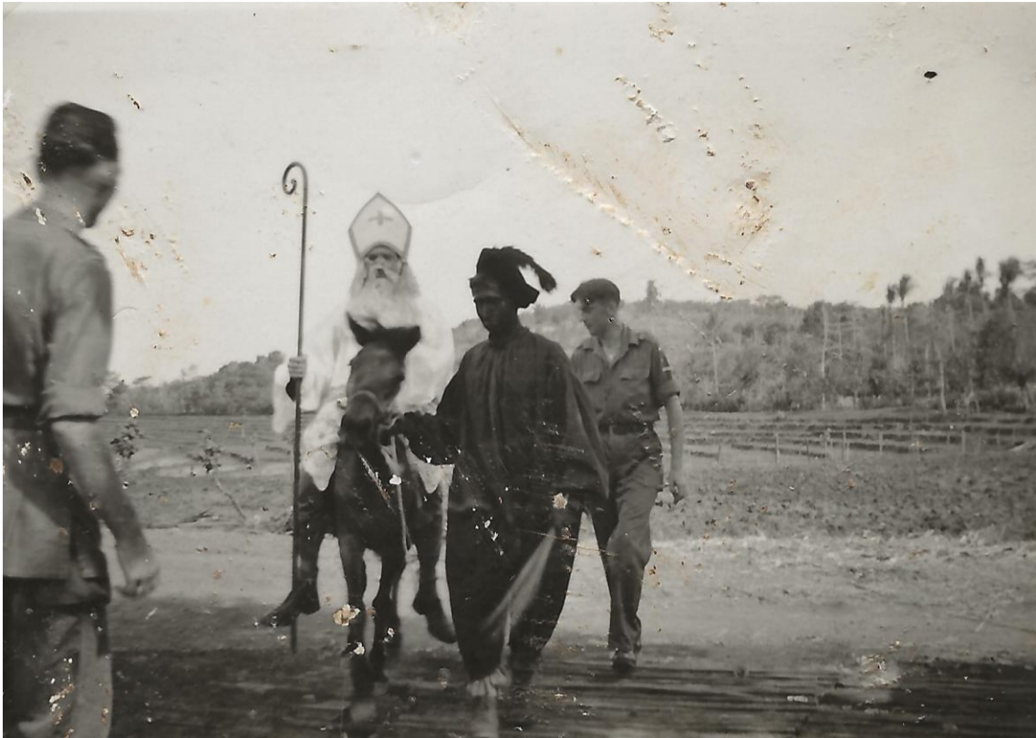
Sinterklaas arriveert op KNIL-paardje.