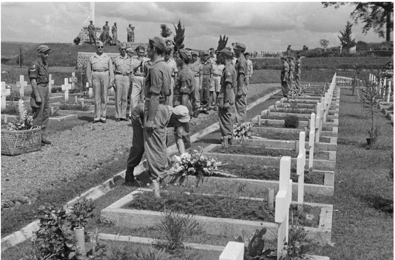
Indrukwekkende dodenherdenking en afscheid gesneuvelden 2-6RI

17 April 1948. Dodenherdenking en kranslegging op het Ereveld. Je hoort er een speld vallen. Er worden indrukwekkende woorden gezegd. Harde soldaten laten hun tranen vloeien. Helaas zij die hier liggen kunnen niet met ons mee. Voor hun vrouw, kinderen, vriendin, hun ouders is er geen souvenirje uit Indie. Hun souvenir zal voor altijd de Jobstijding zijn die zij thuis gekregen hebben van het Ministerie van Defensie of van de Pastoor of Dominee. De grootse plechtigheid onder de enorme hitte van de tropenzon zal mij zeker lang bijblijven. Bij de uitgang kijk ik nog even om en de namen en gezichten zie ik weer voor mij. Ook het Bergse "oudoe" is hier op zijn plaats.