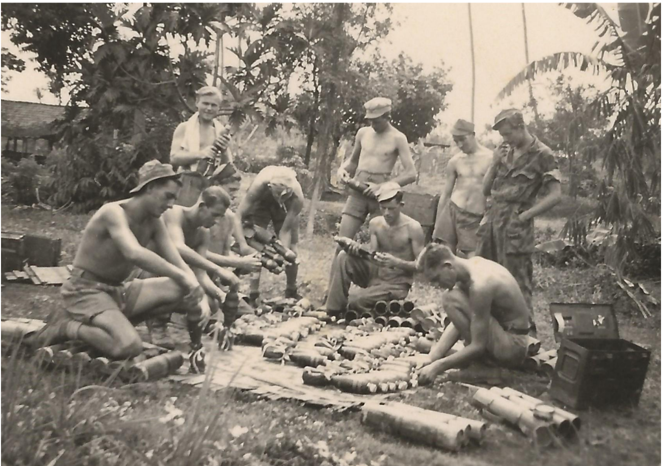
Controle munitie. Ost.Comp. zware mortieren.

30 Juni 1947. Controle op munitie en wapens. We krijgen twee dagen voorraad.