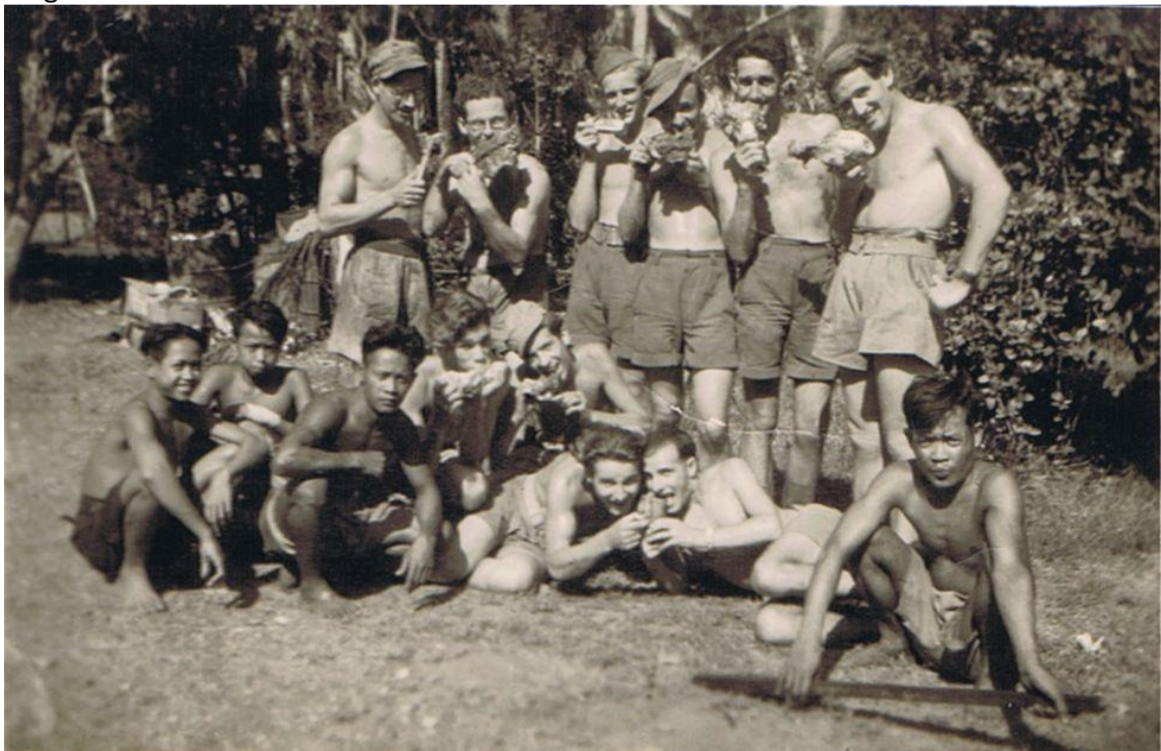
25 Okt.46. Wie nog een boutje?