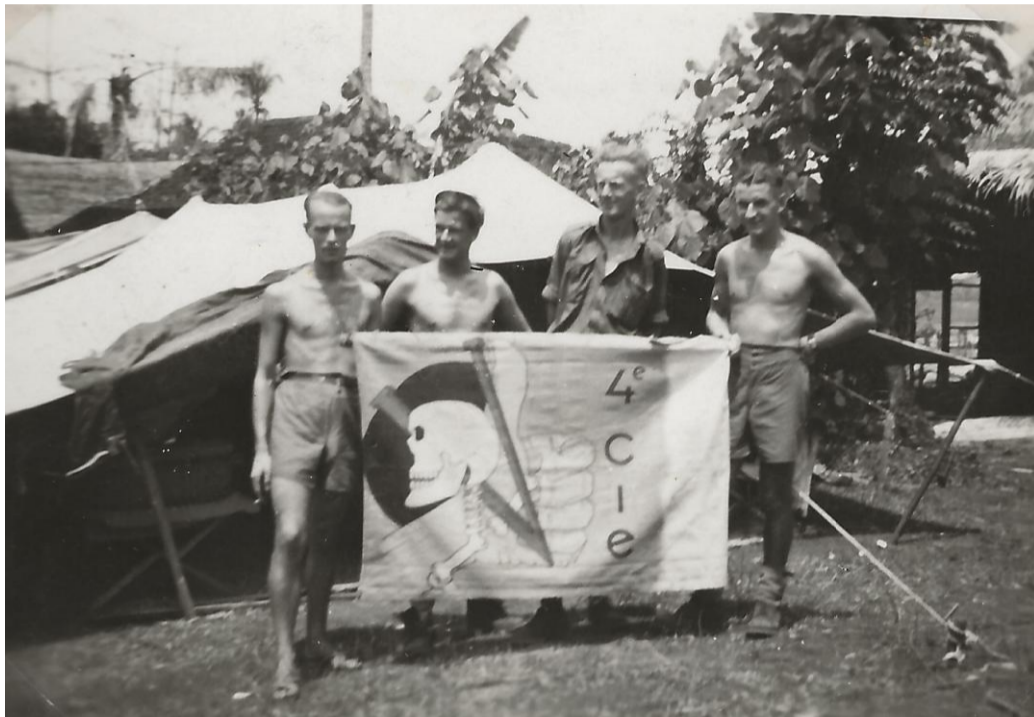
Vlag 4-2-6RI. Cats rechts.

16 Oct 1946. Vlag klaar. Foto's gemaakt van de vlag. Patrouilles voor evacués. Ontvangen hevig vuur van vijand maar er komen toch 150 evacués door de linies.