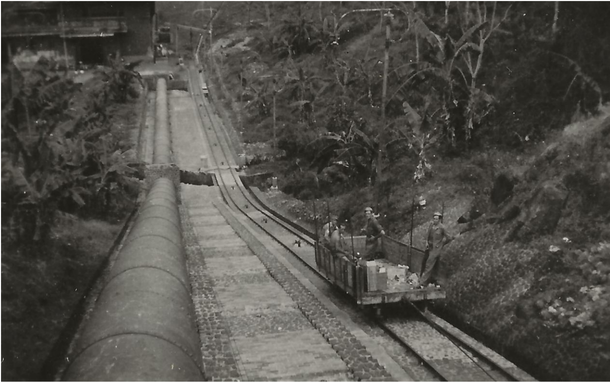
Gemak dient de mens. Djelok centrale.

10 Aug 1947. Vrij van directe dienst, wel in centrale blijven. Veel bevolking keert weer terug, maar ook de ongere elementen lopen er tussen. De patrouilles en de inlichtingendienst hebben het vrij druk met ondervragingen van terugkerende bevolking. Zij kunnen precies vertellen wat er achter het front en in de vrije zone is. Onze patrouilles gaan dan ook altijd op stap met tolken van het K.N.I.L. en I.D..