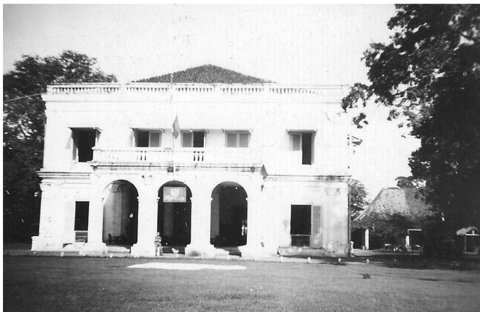
De Tijgerclub Semarang.

23 Mrt 1948. Dag verlof in Semarang. Besteed deze dag grotendeels aan het kopen van cadeautjes. Kocht 2 vulpennen, 2 zilveren broches, echt mooi Indisch, 1 Zilver halskruisje, 7 zilveren lepeltjes op een hangrekje, echt mooi vind ik zelf. Verder nog een slot voor mijn kist die ik ondertussen georganiseerd heb. Verder de avond doorgebracht in een luidruchtige Tijgerclub, daar waren veel zes R.I.ers die vertrek al aan het vieren schijnbaar. Ik was 's nachts om een uur thuis.