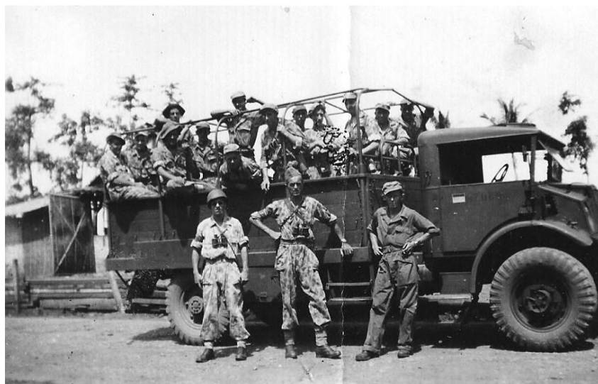
Op de wagen.

Wanneer we wacht hebben, slapen de reservemensen als het ware in het mitrailleurnest, naast de man achter de bren. Het is nu een tijd dat een man voor drie moet tellen. Overal voeren we actie om de vijand te intimideren. en geen kans geven om onze sterkte te polsen. Op de 24 uur wordt er niet meer geslapen dan 4 of 6 uur. Uit de kleren komen we niet. Het eten loop je wel eens mis, omdat je net uit de stelling recht op de auto moest voor een actie, in plaats van aan tafel om te eten. Toch blijft het moreel goed.