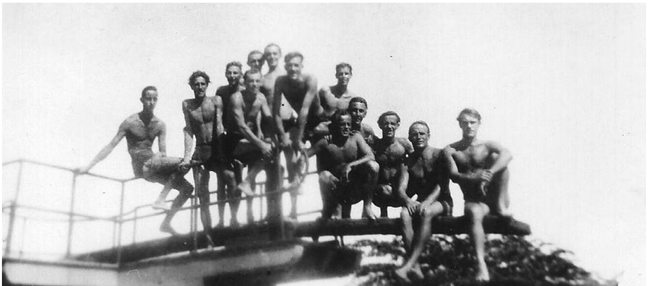
Mrt 47. Zwembad Semarang.

15 mrt 1947. Wacht. Sportdag. Naar het zwembad en hardlopen. 's Middags een poos lekker uitslapen Soldaat Veeken verjaart.