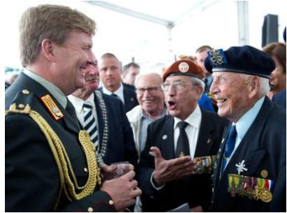
(prins Willem Alexander met o.a. Hans van Dijk 3MPiV, 2-6 RI, T-Brigade)

Prins Willem-Alexander heeft deze 25 e herdenking bijgewoond en een krans gelegd bij het Indië-monument ter nagedachtenis aan de ruim 6200 Nederlandse militairen die in de periode 1945-1962 om het leven kwamen. Tijdens de herdenkingsplechtigheid waren ook (nu voormalig) minister van Defensie Hans Hillen en T. Middendorp, commandant der Strijdkrachten. Er waren zo'n 20.000 mensen aanwezig in het stadspark Hattum. Na de kranslegging werd een minuut stilte gehouden en vlogen vier F16's in de lost man formatie over het monument. Later volgde een defilé. Na afloop van de plechtigheid sprak de prins in de biertent met een aantal veteranen.